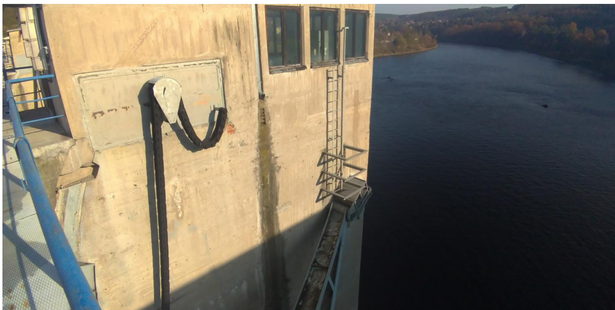
Foto č.3 – Gallovy řetězy, jejich krycí plechy a přístupový žebřík k ramenu segmentu